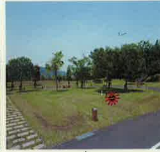
B-18 ☆テントスペース 5m x 4m バックスペース 5m