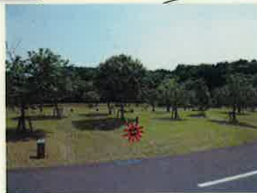
B-14 ☆テントスペース 5m x 5m + 2m バックスペース 5m