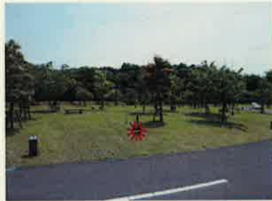
B-15 ☆テントスペース 5m x 3.5m バックスペース 5m