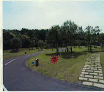
B-17 ☆テントスペース 5m x 4m バックスペース 5