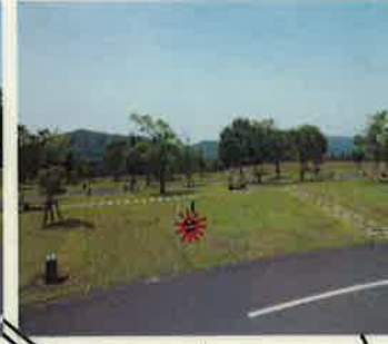
B-19 ☆テントスペース 5m x 5m バックスペース なし