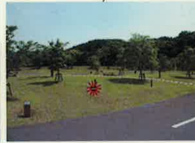
B-13 ☆テントスペース 5m x 5m バックスペース 3m