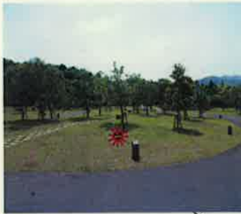
B-16 ☆テントスペース 4m x 4m バックスペース なし