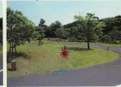
B-12 ☆テントスペース 5m x 5m 斜め バックスペース 5m